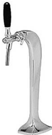
Biersäule Cobra glänzend