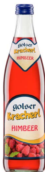
Golser Kracherl Himbeer Wie aus Kindertagen 0,5lt