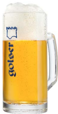
Golser Krug „Frankenseidel“ 0,3lt / 0,5lt