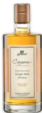
Golser Camum Single Malt Whiskey Vintage 2016 In kleinen Fässern uralt gereift