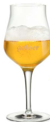
Golser Tulpe „Sensorik“ 0,2lt