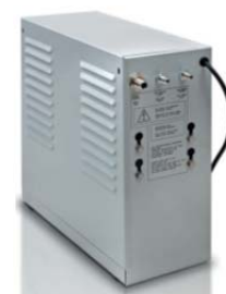
Cornelius Balance Stoßkarbonator