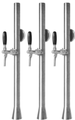
Rohrsäule Solo matt oder glänzend

Unsere wichtigsten Schanktechnik-Komponenten in der Übersicht: