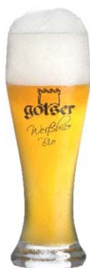
Golser Pokal „Königssee“ 0,3lt / 0,5lt