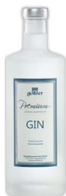
Golser Premium Gin Kräutrig grasiger Gin