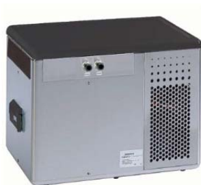
Cornelius CR70 Durchlaufkühler 6-ltg