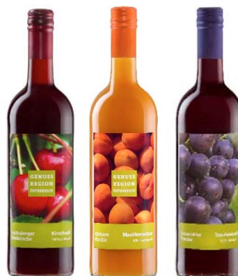
Fruchtsäfte Heimische Obstsorten