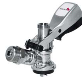
Korbfitting Golser Anstich