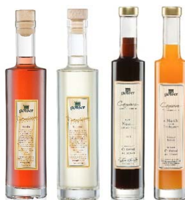
Golser Brände & Liköre Variantenreiches Sortiment