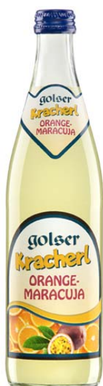
Golser Kracherl Orange-Maracuja Durstlöschende Limo 0,5lt