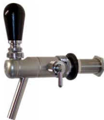
Bierhahn Eurostar Junior Voll-Edelstahl mit Kompensator