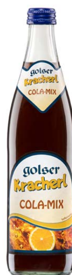
Golser Kracherl Cola-Mix Erfrischendes "Spezi" 0,5lt

Golser Kracherl sind ausschließlich im wieder-verschließbaren Mehrweggebinde zu 0,5lt erhältlich. Unsere Limonaden zeichnen sich durch Regionalität, Wirtschaftlichkeit und Nachhaltigkeit aus.